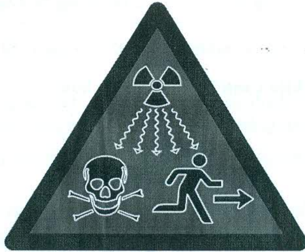
Hình 2: Dấu hiệu cảnh báo bức xạ ion hóa bổ sung sử dụng cho các nguồn phóng xạ thuộc mức an ninh A, B và C

Kích thước, màu sắc của dấu hiệu cảnh báo bức xạ ion hóa bổ sung thực hiện theo Tiêu chuẩn quốc gia TCVN 8663:2011 ISO 21482:2007